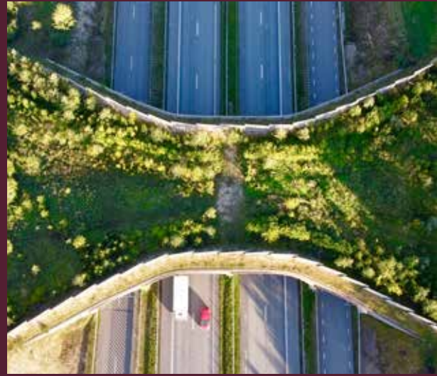
Faunabro bygget over motorvej.

Ikke mange i Danmark har set en hasselmus. Dels fordi den er nataktiv, men også fordi der ikke er så mange. Få steder passer lige netop til den. Det er derfor, den er truet. Hasselmusen vil gerne bo i en skov eller et skovbryn. Der skal være høj diversitet af buske og urter i skovbunden. Den slags steder findes der ikke så mange af i Danmark.